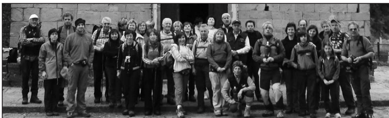
Il numeroso gruppo che ha partecipato alla gita.