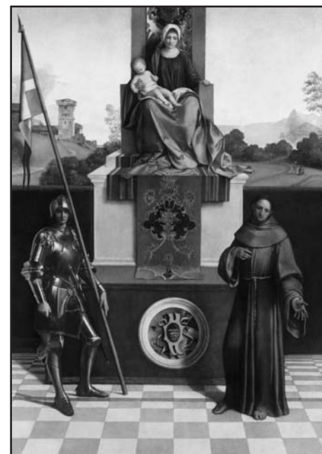
Castelfranco Veneto: la pala del Giorgione.

L'incontro con il Giorgione si è concluso con la visita alla "Madonna col Bambino e i santi Nicasio e Francesco", meglio nota come Pala di Castelfranco, lasciata dai curatori della mostra nel suo ambiente