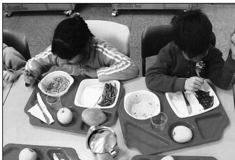
I bambini sono naturalmente socievoli: non distruggiamo la loro spontanea e innocente apertura con i preconcetti ideologici degli adulti.

per la promozione in classe di progetti che qualificano sempre più la didattica, avvalendosi di esperti qualificati in settori specifici, e può accadere che, in mancanza di finanziamenti pubblici sufficienti, chieda piccoli contributi alle famiglie per realizzare questi progetti (es. 6 euro annui ad alunno per un progetto musicale). Queste somme, consi-