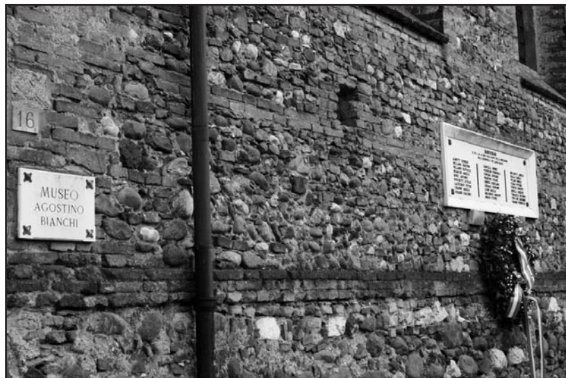
Piazza Teatro: il museo intitolato al maestro Agostino Bianchi e la lapide in memoria dei monteclearensi caduti nella Resistenza e nei Lager nazisti.

PER INVIO COMUNICATI: Tipografia Ciessegrafica info@ciessegrafica.it Tel. 335.6551349